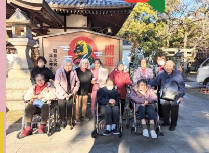
初詣に行ってきました！