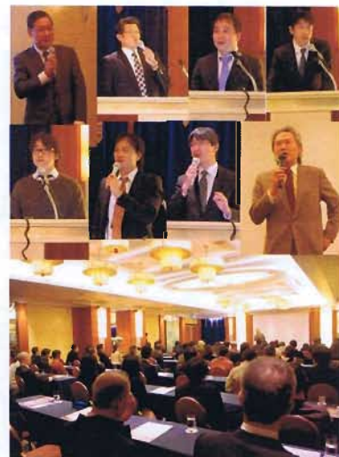
総勢 94名で盛況に終わりました。